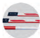
Стрелы плоского и круглого сечения