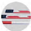
Стрелы плоского и круглого сечения